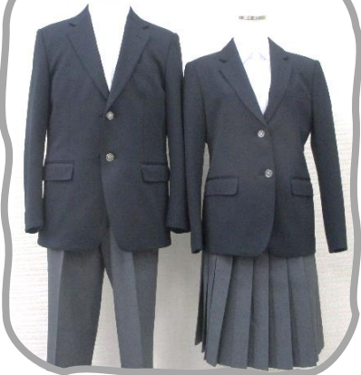
濃紺 & グレー