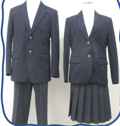
濃紺 & チャコールグレー