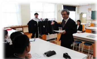
委員長より趣旨説明↑

「意見交換会」において、代表生徒たちは、興味深く熱心に会に臨みました。上下の色の組み合わせ、柄と無地との比較考察などを丁寧に行う姿がありました。